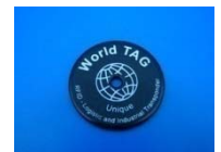
TRP World Tag 125kHz