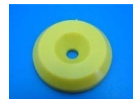
TRP PU Tag 125kHz