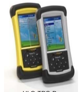
HLG TDS Recon