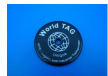
TRP World Tag 125kHz