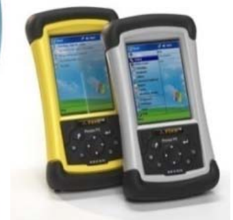
HLG TDS Recon