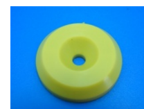
TRP PU Tag 125kHz